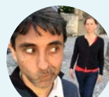
LE CARGO VOLANT